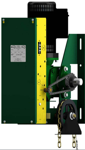
Motor Manaras Heavy Duty